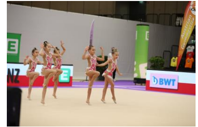
Die Kleinsten der Sportunion ADM Linz in Graz