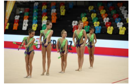
Gruppe ÖTB Linz Jugend A in Graz

Österreichs Auswahl beendete die 1. Juniorinnen-