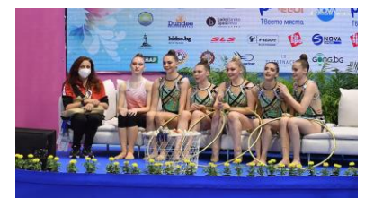
Österr. Nationalgruppe bei den Eu-