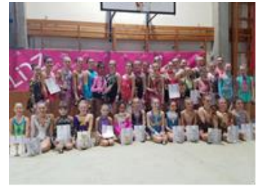
Linzer Stadtmeisterschaften im Sommerhaus Linz

In der Turnhalle des Europagymnasiums Auhof organisierte die Sparte RG des OÖFT die Bundesmeisterschaften 2021.